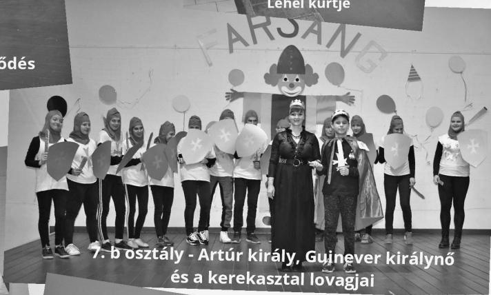
7. b osztály - Artúr király, Guinever királynő és a kerekasztal lovagjai