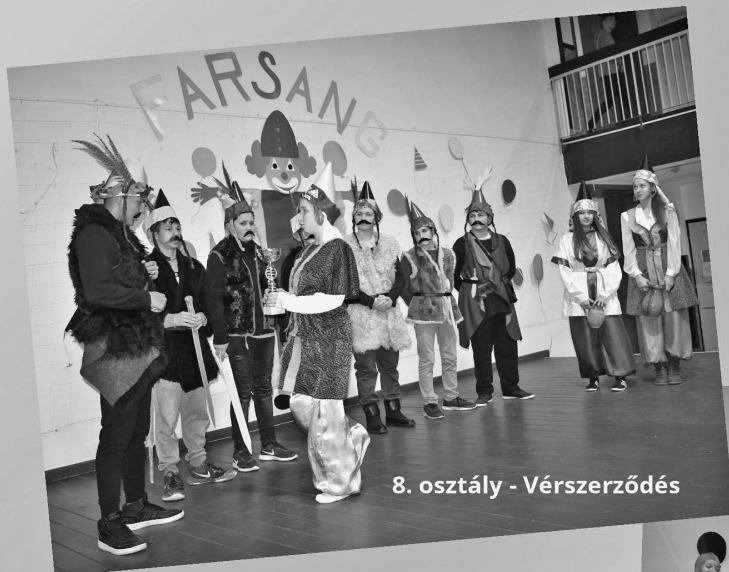
8. osztály - Vérszerződés