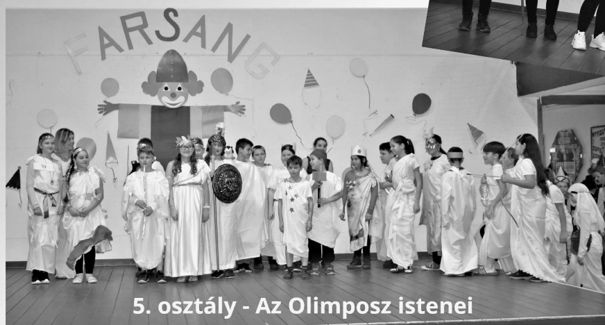
5. osztály - Az Olimposz istenei