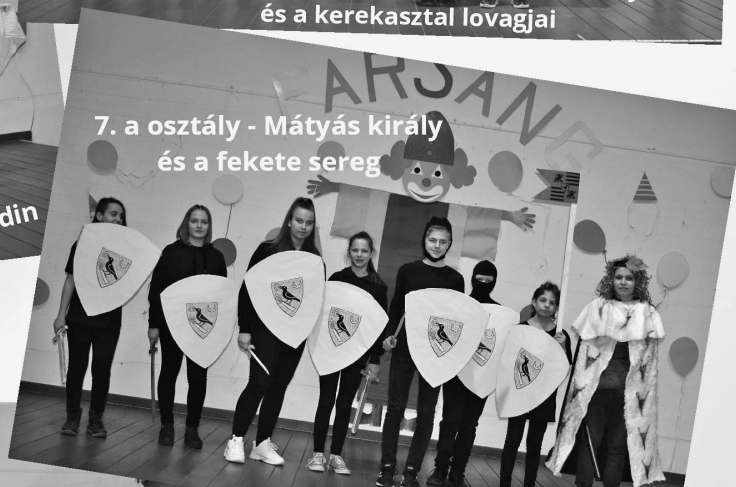
7. a osztály - Mátyás király és a fekete sereg