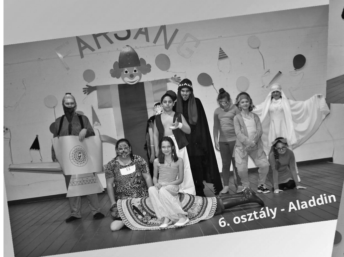
6. osztály - Aladdin